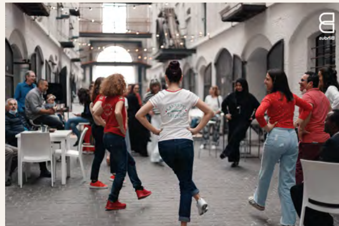
Let's Bind Us