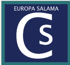
Integratie Bemiddeling – Tolk

We geven hier een overzicht van de projecten die dit jaar de Bindussubsidie gewonnen hebben: